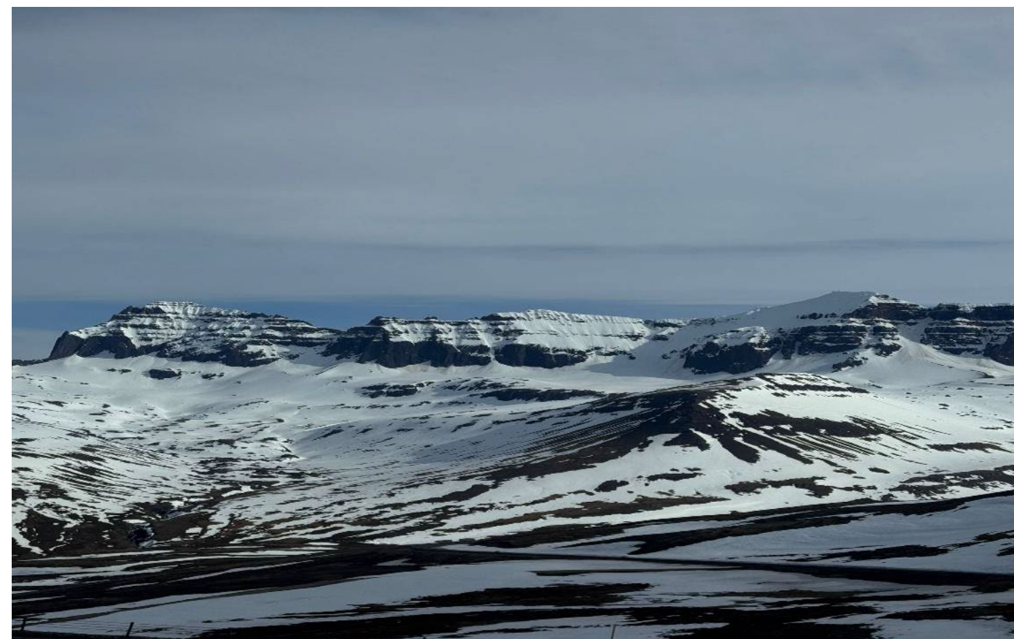
Eglisstadir toukokuun aikana