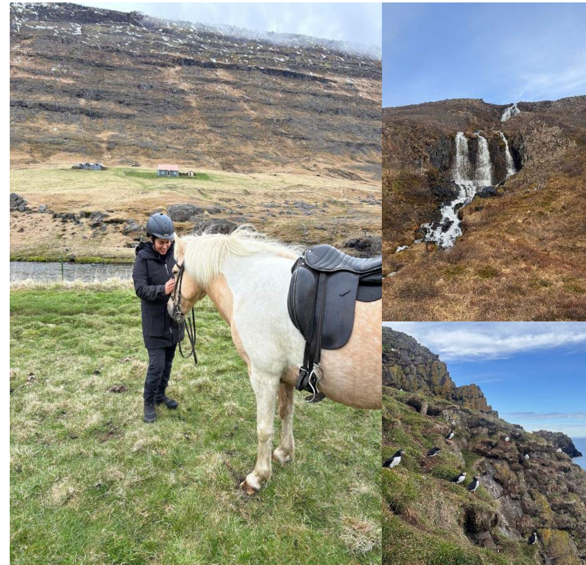
Aktiviteetteja, kuten ratsastusta, lunninkatselua ja luonnon tarkkailua

Koe vapaa-ajalla: Tutustu upeisiin vaellusreitteihin (kuten 15 vesiputouksen reitti), ratsasta islanninhevosilla ja ylitä Jökulsá-joki perinteisellä käsikäyttöisellä köysivaunulla!