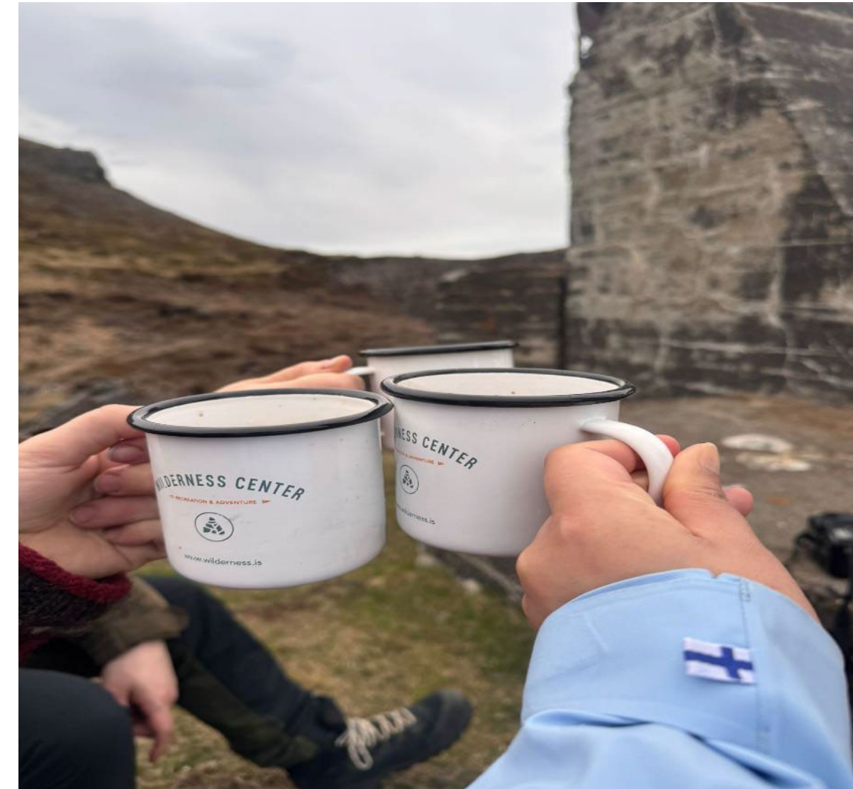
Hengailemassa työkaverin kanssa luonnossa

Sopeutumiskyky ja kyky itsenäiseen työhön erilaisten tehtävien välillä antoivat erinomaiset eväät tuleviin matkailualan asiantuntija- ja kehitystehtäviin.