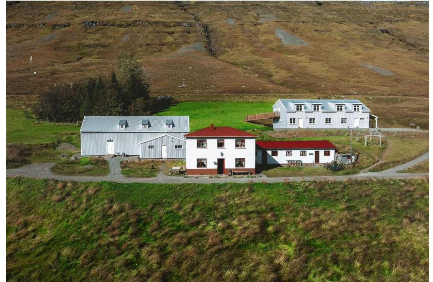
Kuva erämaakeskuksesta museoineen

Asiakaskunta: Palvelee vastuullisia ekomatkaajia, historian harrastajia, luontoseikkailijoita ja kansainvälisiä uniikkien elämysten etsijöitä.